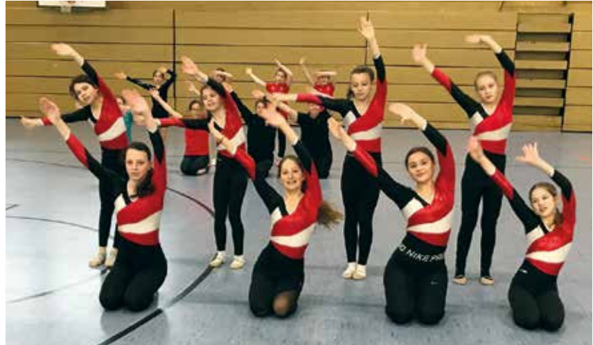
Teilnehmerinnen beim „Bongoman“

Die Ausschreibung findet Ihr auf der PTB-Homepage. Bei Fragen meldet Euch!