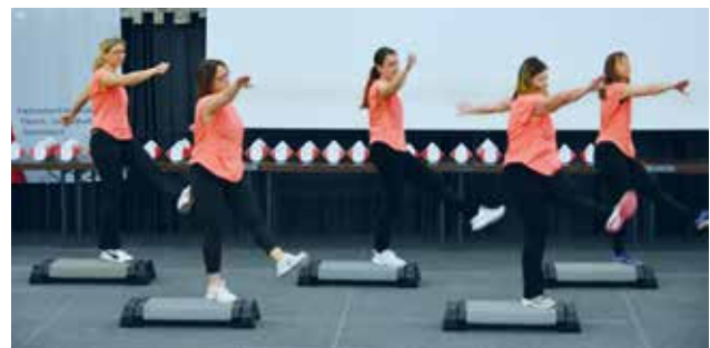
Step Gruppe VT Frankenthal