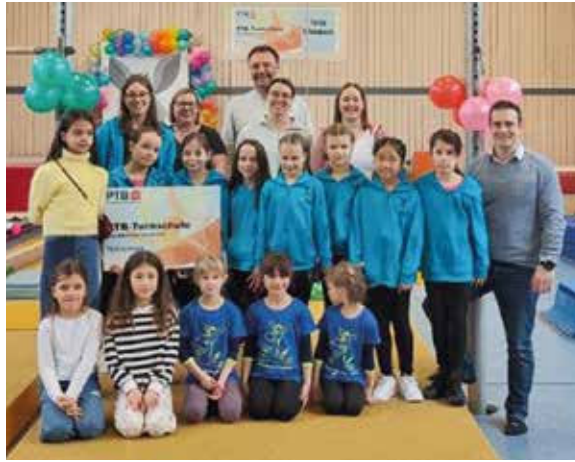
Prädikatsvergabe an den TV Erlenbach