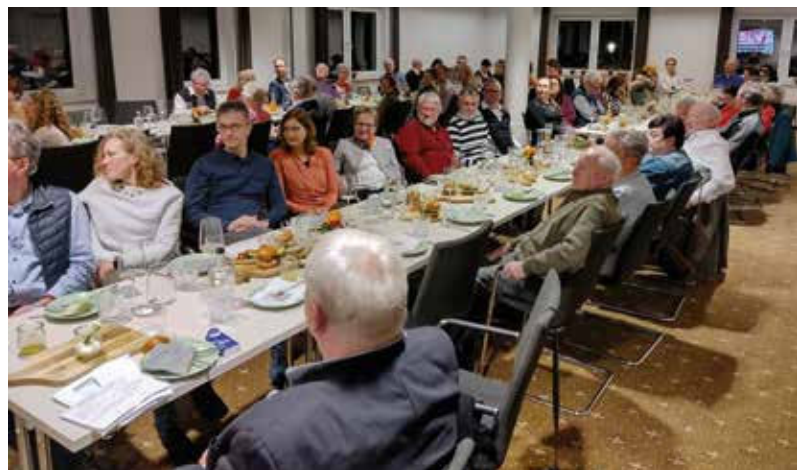
Der Festsaal war mit den Gästen gut gefüllt