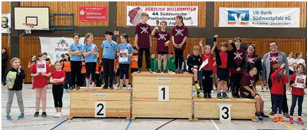
Siegerehrung Minis Süddeutsche Meisterschaften