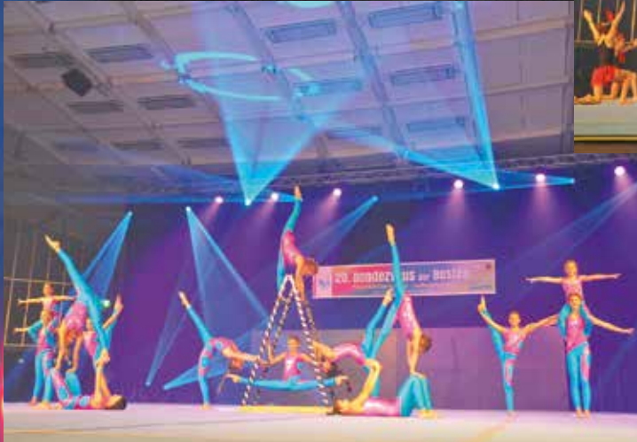
TS Rodalben - Gym & Dance Team 3