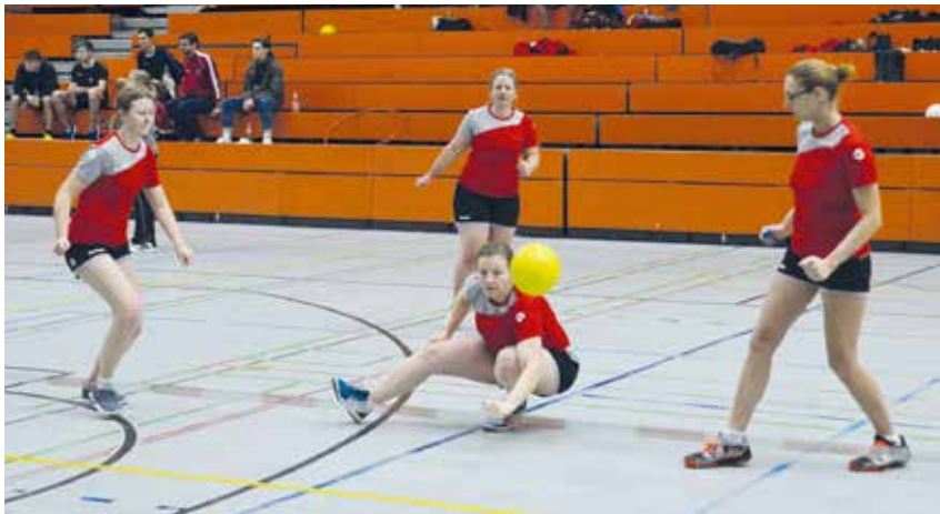
Prellballerinnen des TV Rieschweiler