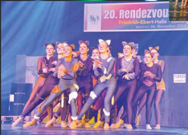
Kolpingfamilie Schifferstadt - Junior Twisters