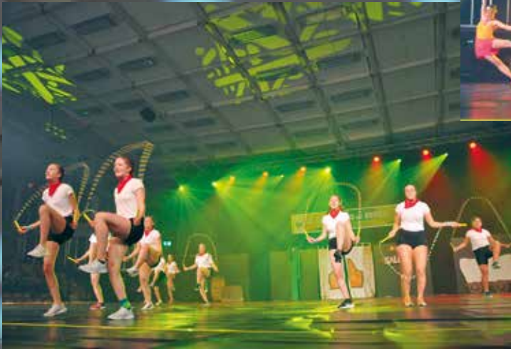
TS Germersheim - Sparkling Skippers