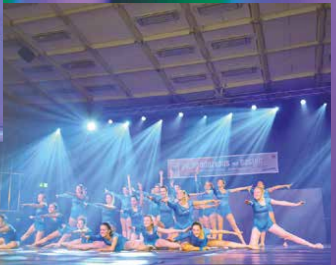
TB Hermersberg - Jugend