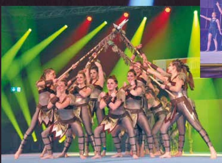
TS Rodalben - Gym & Dance Team 1, 2