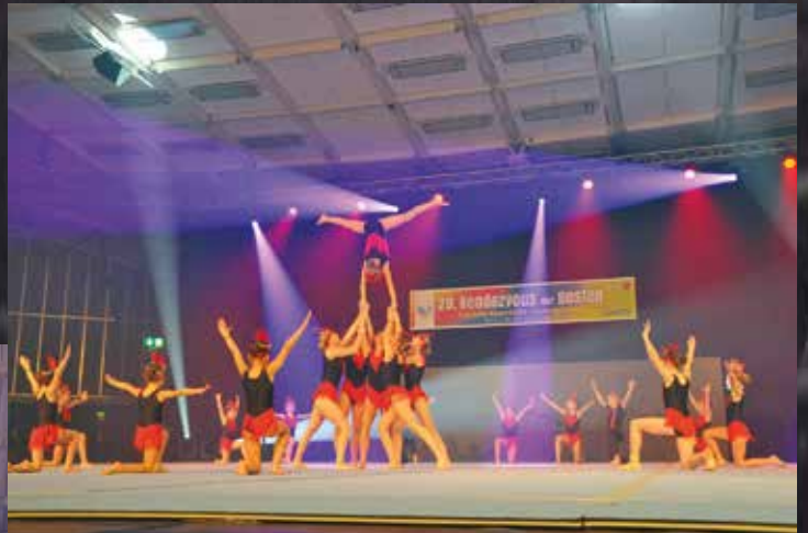
TSG Eisenberg - Crazy Jumpers Kinder