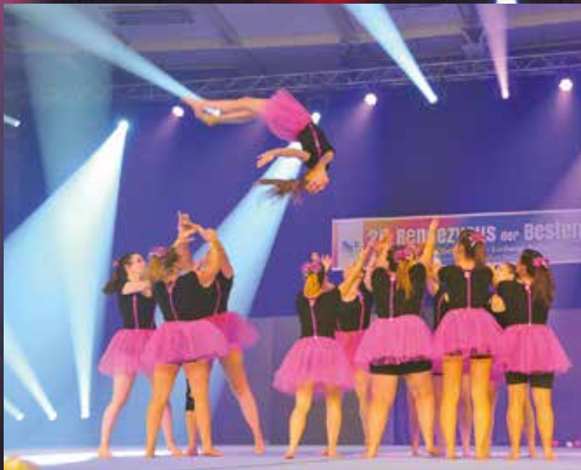
SV Katzweiler - TGM Team