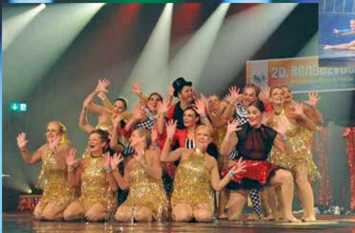
TSV Speyer - Oldies