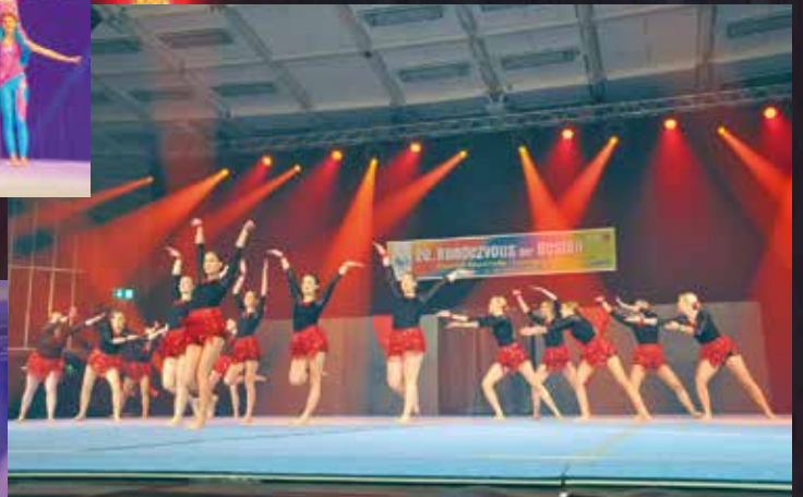
TV Neuburg - Showtanzgruppe Barfuß