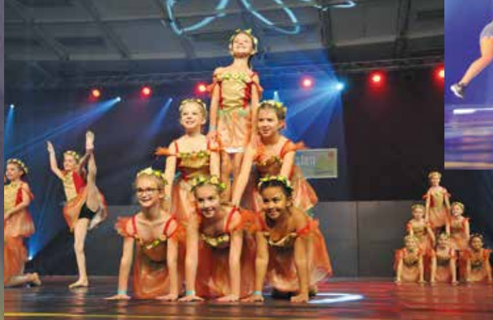
TB Hermersberg - Minis