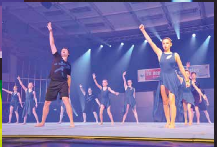
TSG Eisenberg - Crazy Jumpers