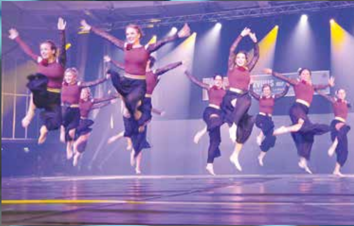
VT Böhl - Just Dance