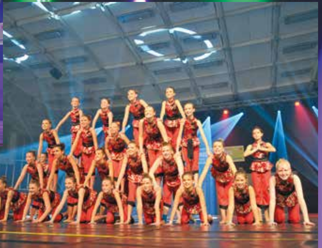
TB Hermersberg - Kinder