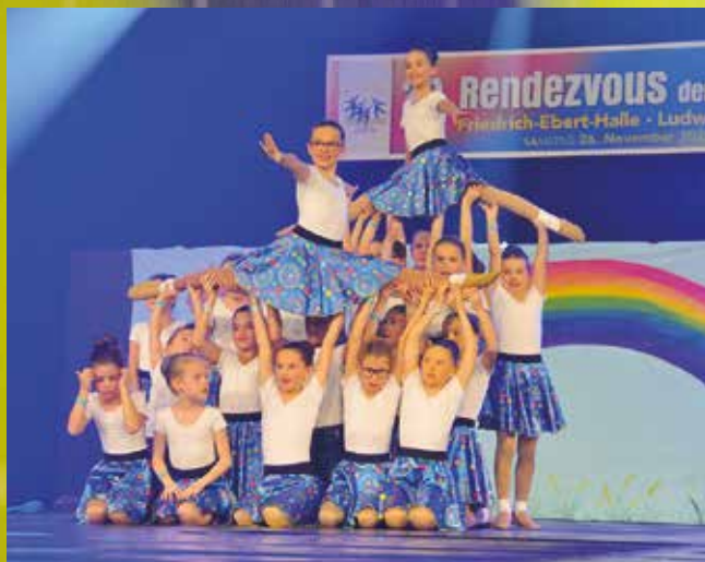
Kolpingfamilie Schifferstadt - Mini Twisters