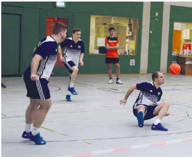
Prellballer des TSV Ludwigshafen