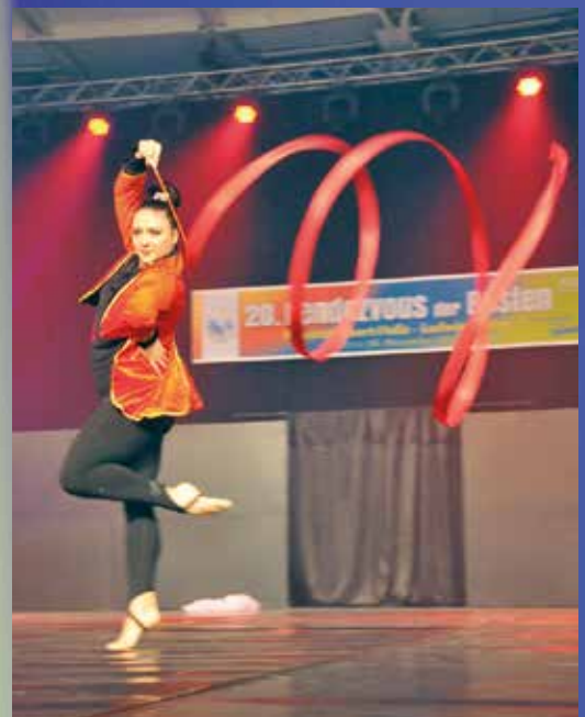
VT Böhl - Bandits & Monsters United