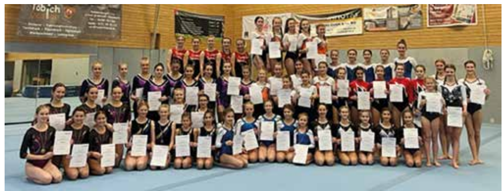
Die pfälzer Teilnehmerinnen am Sonntag

Mit diesem grandiosen Abschluss einer langen Wettkampfsaison können die Pfälzer Turnerinnen und ihre Trainer*innen sehr zufrieden sein.