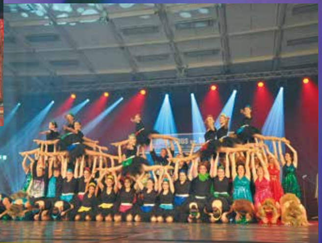
Kolpingfamilie Schifferstadt - Twisters