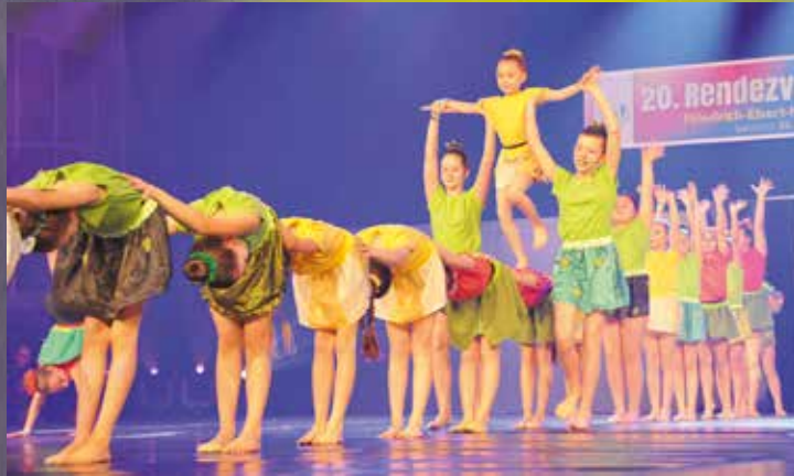
VT Frankenthal - Girlinchen