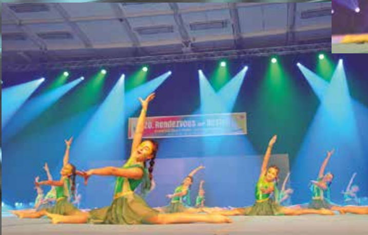
TS Rodalben - Gym & Dance Team 3, 4, 5