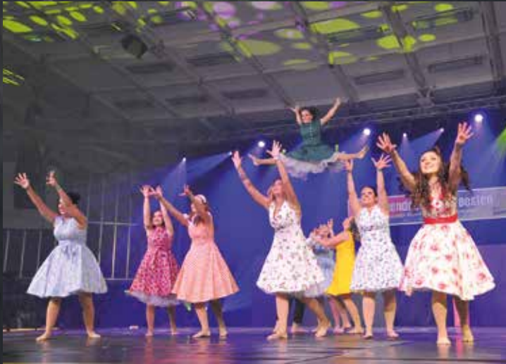
DJK SG Palatia Limburgerhof - For Motion