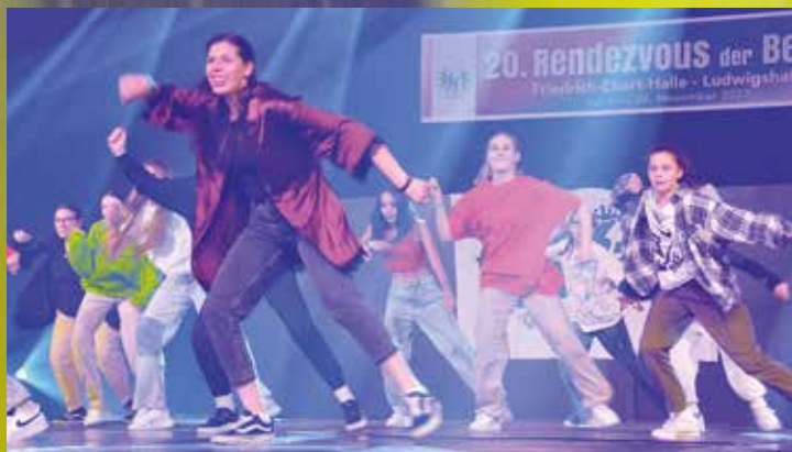
Dany Dance Center - Je suis Dany