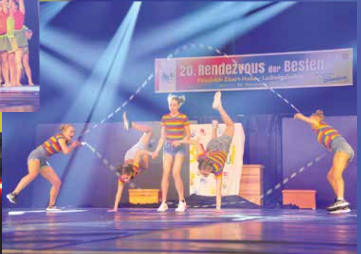
TSV Speyer - Solo